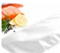
Ajuste para contacto con alimentos