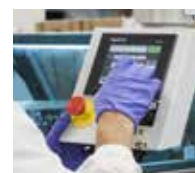
Certificado ISO9001: 2008 Sistema de Gestión de Calidad para bolsas de vacío