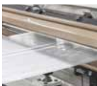
Película de un extrusor de "cabeza plana"