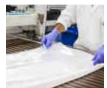
Bolsas de vacío siempre controladas y patentadas