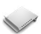
Estantes Planos Inclinados