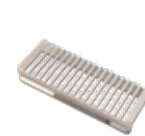
Easy, para la creación del vacío externo