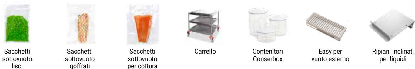
Sacchetti sottovuoto lisci