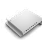
Ripiani inclinati per liquidi