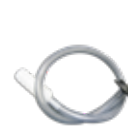
Tubo di aspirazione esterna